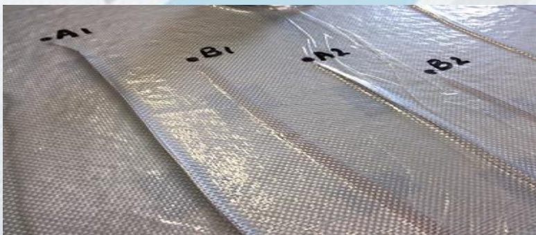
A1/A2 : TC standards