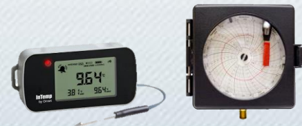
Enregistreur numérique ou graphique